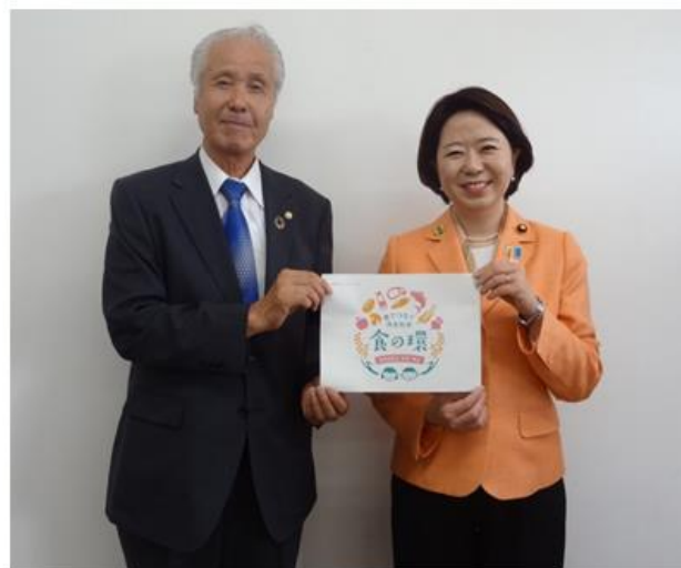
食の環プロジェクト

令和6年9月11日、食品スーパーチェーン・ハローズのご視察時（太田氏ご案内）、弊会の取り組みについて聴取して頂きました。大臣から消費者庁が関係府省庁と調整、策定中の『食品ロス削減基本方針』の参考になることと、新たに『食の環プロジェクト』を開始するにあたり、環境カウンセラー全国連合会に対して普及啓発に取り組むように要請がありました。また、法務大臣面会への随行指示を頂きました。