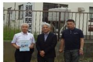
釧路慈徳会施設長と